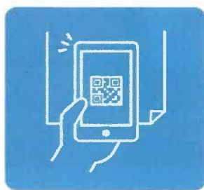
活用疫情通知 COCOA app