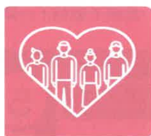
正確了解疫情 防疫為你為我